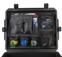
iM27XX-UTILITYORG Отделения для предметов общего назначения