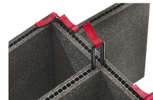
iM2600-TREK TrekPak Koffer Teiler Kit