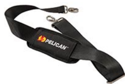
9487 Padded Shoulder Strap