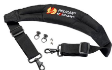
iM-STRAP-S-VER2 Padded Shoulder Strap