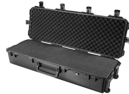
iM3220-X0001 With Foam