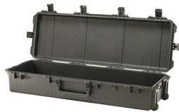
iM3220-X0000 No Foam