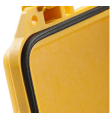
1453 Junta tórica de repuesto