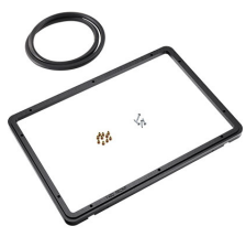
1450PF Panel de adaptación para aplicación especial