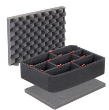
1450TPKIT Kit de divisores TrekPak