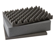
1451 Juego de 3 piezas de espuma de recambio