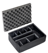
1455 Divisores acolchados