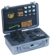
1508 Organizador de tapa para material de fotografía