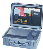
1509 Organizador de tapa