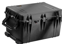
1660NF No Foam