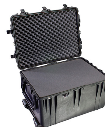
1660WF With Foam