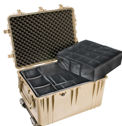
1664 With Padded Dividers