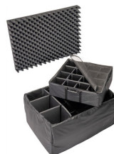
1665 Set di divisori imbottiti