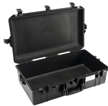
1605NF No Foam