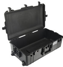
1615NF No Foam