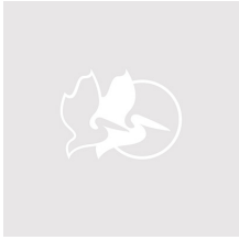
IM27XX-M4-BEZEL-L Lid Bezel (Metric)