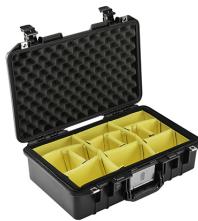
1485WD With Padded Dividers