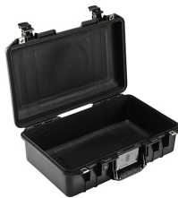
1485NF No Foam