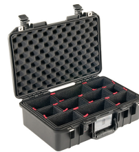
1485TP With TrekPak Divider System