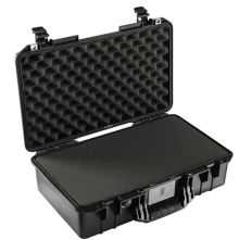
1525WF With Foam