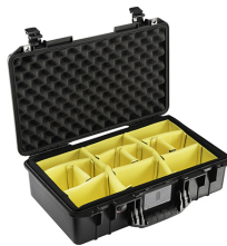
1525WD With Padded Dividers