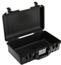
1525NF No Foam