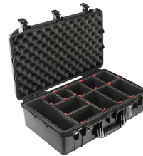
1555TP With TrekPak Divider System