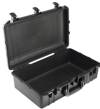
1555NF No Foam