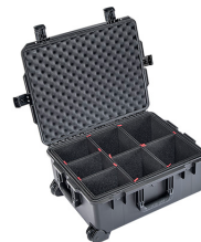
iM2720-X0006 With TrekPak Divider System