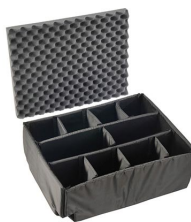
iM2720-DIV Cloison en mousse