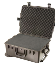
iM2720-X0001 With Foam