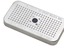
1500D Gel de silice déshydratant Peli