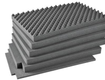
iM2950-FOAM Jeu de mousses de rechange, 6 pièces