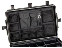
iM29XX-UTILITYORG Pochette utilitaire