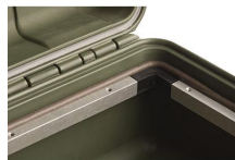
iM29XX-BEZEL Support de platine base