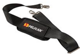
9487 Padded Shoulder Strap