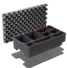
1510TPKIT TrekPak Koffer Teiler Kit