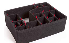
1560EUTP TrekPak Koffer Teiler Kit