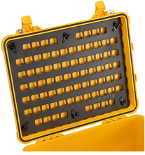
1560MP EZ-Click™ MOLLE Panel