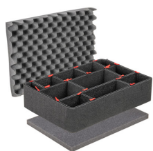
1520TPKIT TrekPak Koffer Teiler Kit