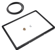
1550PF Panelrahmen für Spezialanwendungen