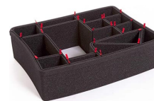
1550EUTP TrekPak Koffer Teiler Kit