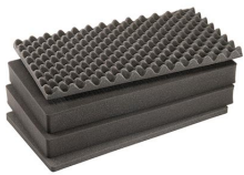
1605AirFS Juego de 4 piezas de espuma de recambio