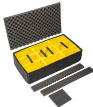
1615AirDS Divisores acolchados