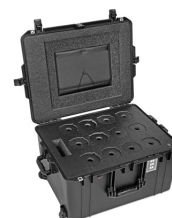
WINE-12B 12-Bottle Wine