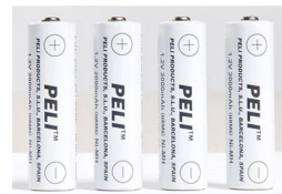
2469P Batería de recambio