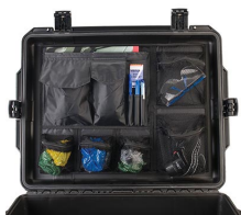
iM27XX-UTILITYORG Organizador de accesorios