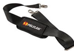
9487 Correa para hombro acolchada