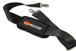
9487 Correa para hombro acolchada