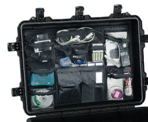
iM3075-UTILITYORG Organizador de accesorios