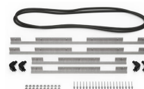
iM3075-M4-BEZEL-L Bisel de la tapa (métrico)