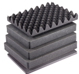
1507AirFS Juego de 5 piezas de espuma de recambio