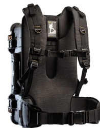
RucPac-Pro-1 Conversión de mochila RucPac Pro Hardcase