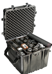
0354 With Padded Dividers