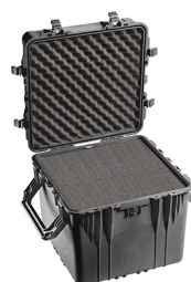
0350WF With Foam