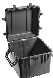
0350NF No Foam