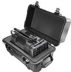
1460AALG Maleta 1460 con espuma de ajuste personalizado