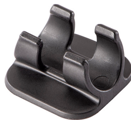
1975H Soporte de linternas para cascos

Peli c/ Provença, 388, Planta 7 • Barcelona, Spain 08025 • Phone: +34 934 674 999 info@peli.com • www.peli.com