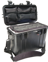
1434 With Padded Dividers & Lid Organizer