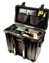
1446 Divisores y organizador de tapa para material de oficina