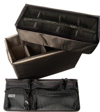
1445 Divisores acolchados y organizador de tapa para accesorios