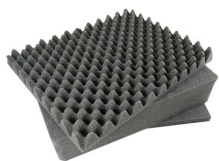
1491 Juego de 3 piezas de espuma de recambio