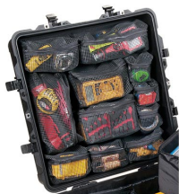
0379 Organizador de tapa