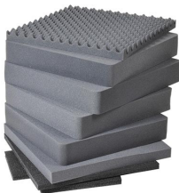
0371 Juego de 8 piezas de espuma de recambio