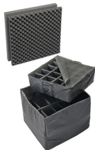
0375 Divisores acolchados