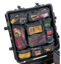
0379 Organizador de tapa