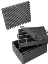
1645 Divisores acolchados