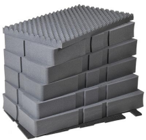
0501 Juego de 7 piezas de espuma de recambio