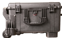
1620WF With Foam