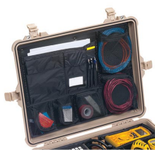
1609 Organizador de tapa