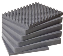
1621 Juego de 6 piezas de espuma de recambio