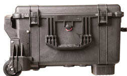
1620MNF No Foam