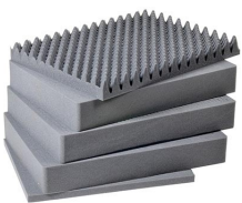
1661 Juego de 5 piezas de espuma de recambio