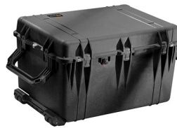
1660NF No Foam