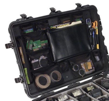
1669 Organizador de material fotográfico/tapa