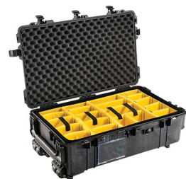
1674 With Padded Dividers