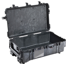
1670NF No Foam