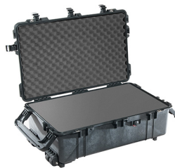
1670WF With Foam