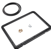
1400PF Panel de adaptación para aplicación especial