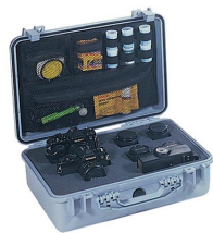
1508 Organizador de tapa para material de fotografía