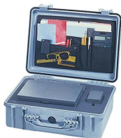
1509 Organizador de tapa