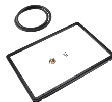
1520PF Panel de adaptación para aplicación especial