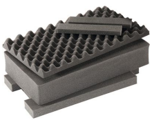
1535AirFS Juego de 3 piezas de espuma de recambio