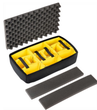
1535AirDS Divisores acolchados