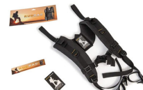
RucPac-normal Conversión de mochila RucPac estándar Hardcase