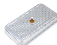
1500D Gel de sílice desecante